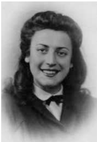
Дата рождения: 11 марта 1927 г., Специя Заключение в Равенсбрюке: с октября 1944 г. по апрель 1945 г.

Брат моей мамы был одним из партизан патриотического подразделения GAP (Gruppi di azione patriottica). В связи с полученной информацией о тайной встрече гестапо вторглось в ее дом и арестовало всех. Мои мать и бабушка были доставлены в штаб-квартиру, где их допрашивали, но они ничего не рассказали, а затем их перевели в тюрьму Villa Andreini, а позже – в Равенсбрюк.